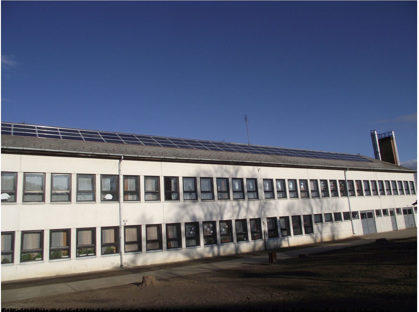
Működési és üzemeltetési szabályzatok, eljárási utasítások, munkajogi és munkavédelmi szabályzatok, egészségügyi eljárási utasítások, munkajogi és munkavédelmi szabályzatok, egészségügyi eljárási utasítások.