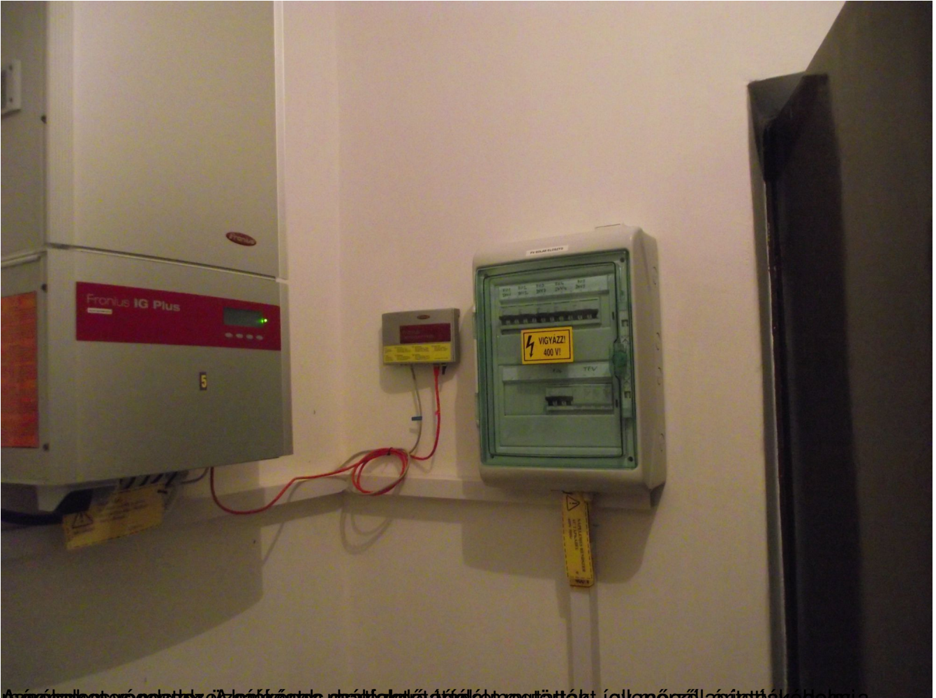
A képen látható eszközök a hálózati áramellátást megintették, így még az áramtárolás, de újra