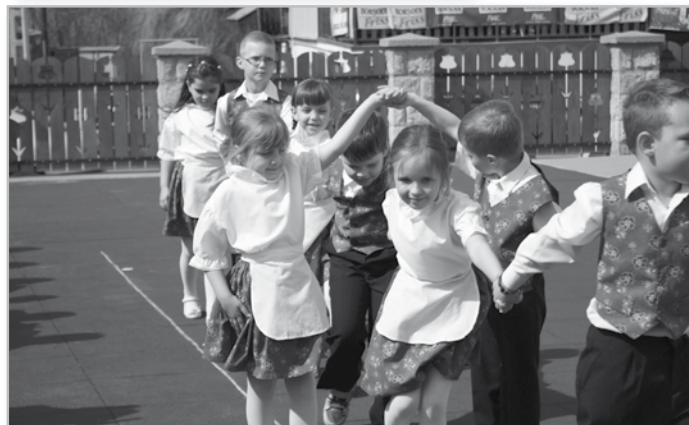
A Pillangó csoport néptánca