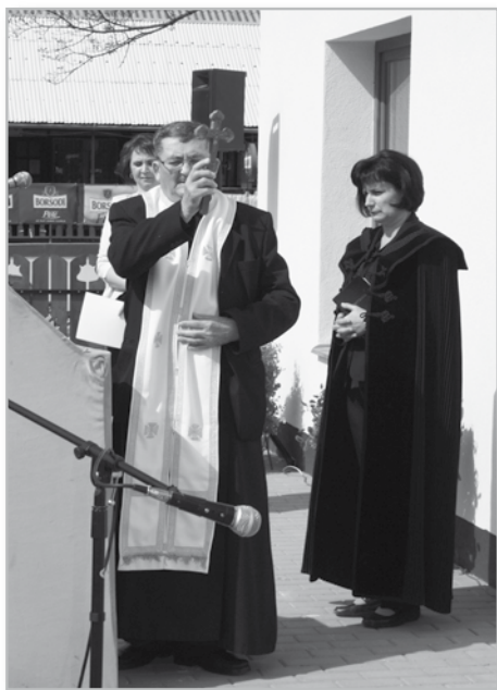
Az új óvoda megáldása, megszentelése