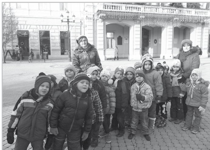
A karácsonyi forgatagban

Adventi időszakunk második nagy eseménye a karácsony. Lázás készülődés folyik napról-napra óvodánkban. Szeretnék meghívni minden kedves érdeklődőt a karácsonyi műsorunkra, ami a református templomban kerül megrendezésre. Ideje: 2013. december 20. 14.00 órai kezdettel.