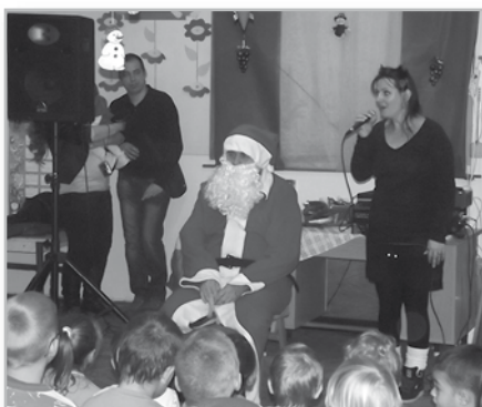
A várva-várt Mikulás