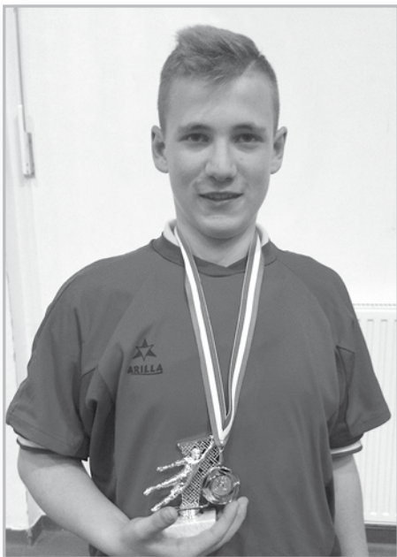
A torna legjobb kapusa