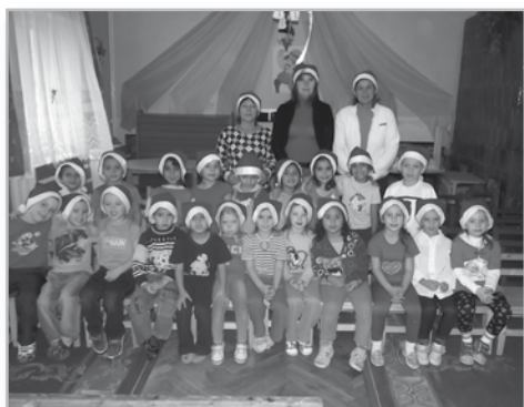
Már várjuk az oviban a Mikulást