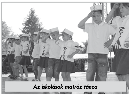
Az iskolások matróz tánca