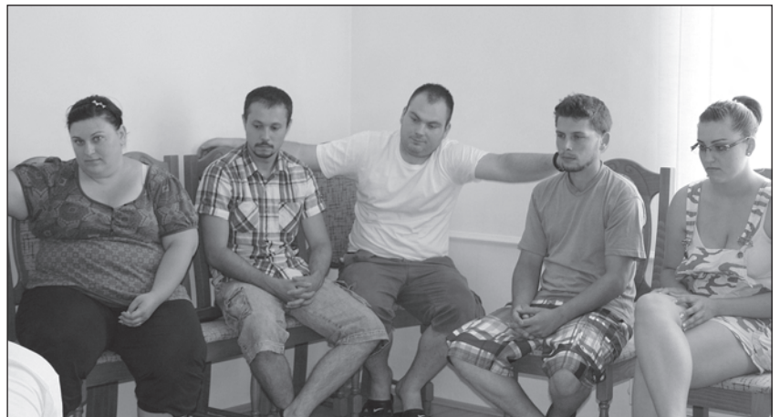
Polgárőrök előadás közben