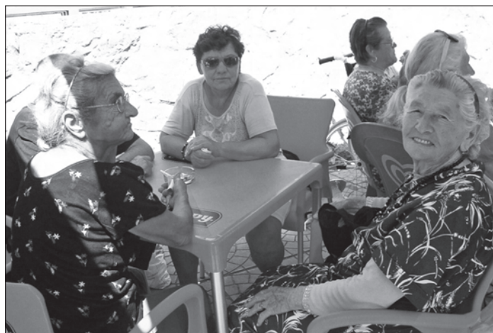
Alig fáradtan a legidősebb kirándulónk