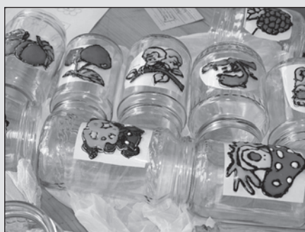
Az elkészült munkák