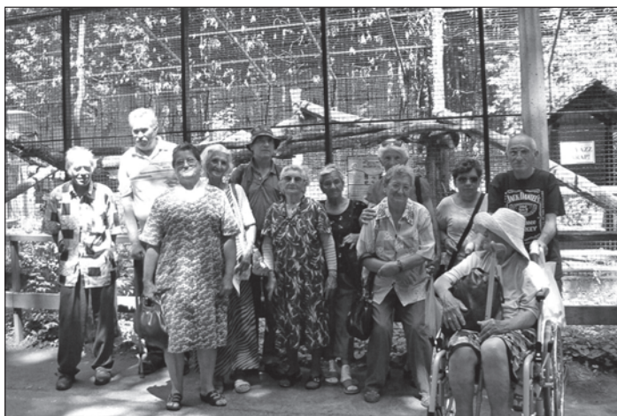
A kirándulók kis csapata