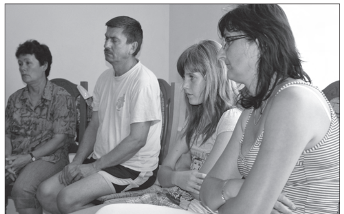
A résztvevők egy csoportja