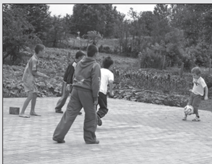
A fiúk fociznak